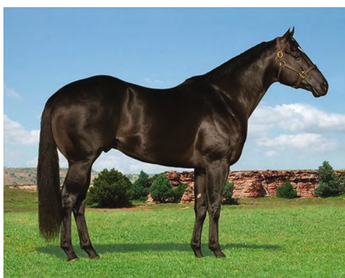
Fig.2 The Quarter stallion – Corona Cartel